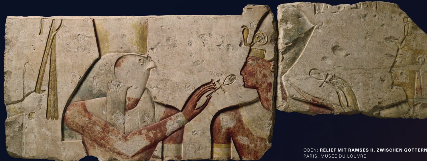
OBEN: RELIEF MIT RAMSES II. ZWISCHEN GÖTTERN PARIS, MUSÉE DU LOUVRE

Tel. +49 (0) 721 / 926 6520 (Mo – Do 9 – 12 Uhr und 14 – 17 Uhr, Fr 9 – 12 Uhr) Fax +49 (0) 721 / 926 6537, service@landmuseum.de