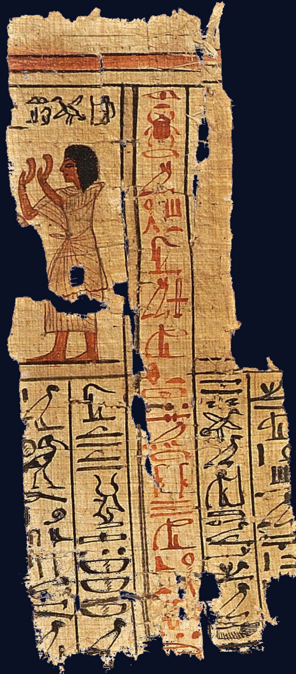
AUSSCHNITT AUS DEM TOTENBUCHPAPYRUS DES PASER